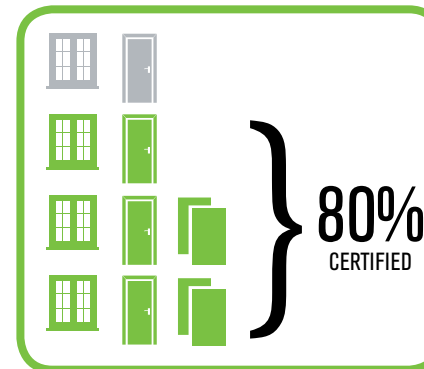
Lihtne protsendiline jaotus

Mistahes projekti on kaasatud mitmed tarnijad, kes kõik pakuvad erineva sertifitseerimisosaaluga materjali. Et kõigile asjaosalistele protsess lihtsaks ja selgesti mõistetavaks teha, kasutab PEFC projektipõhise tarneahela sertifikaat lihtsat protsendipõhist meetodit, et arvesse võtta projektis kasutatav PEFC sertifikaadiga materjal.